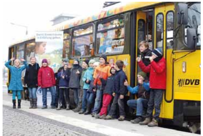
Abschlussveranstaltung der Kampagne „Kinderrechte kommen in Fahrt“ mit der Kinderstraßenbahn „Lottchen“ am 20.11.2012 in Dresden