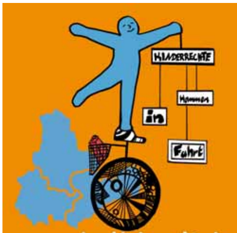
Logo der Kampagne „Kinderrechte kommen in Fahrt“